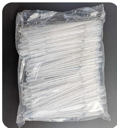
3, 5 y 10 ml